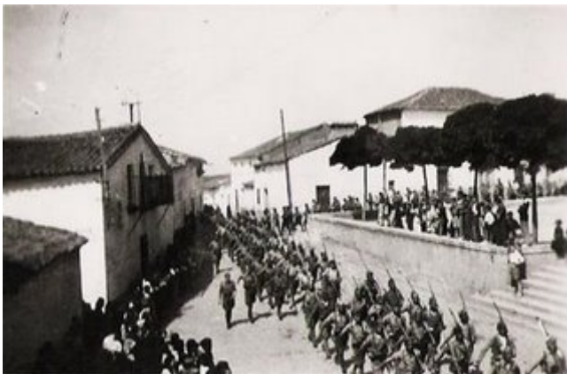
Entrada de las tropas de Yagüe en Guareña (Badajoz).

Finales de agosto de 1936. La columna de la muerte de Yagüe ha dejado sus huellas en Almendralejo, Mérida, Zafra y otras localidades de la Vía de la Plata donde, según el dirigente socialista Julián Zugazagoitia , dicen que "les han dado a los campesinos la reforma agraria, proporcionándoles un pedazo de tierra sin renta y para siempre" .