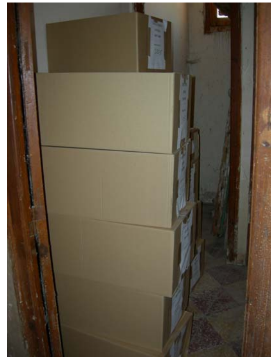
Fig. 7 Situación del material arqueológico en fecha 1 de agosto de 2008.