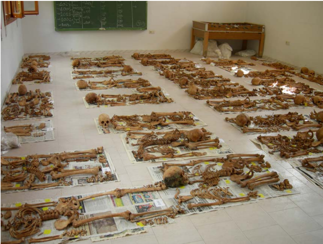
Fig. 1 Limpieza y secado de los restos humanos para su posterior estudio