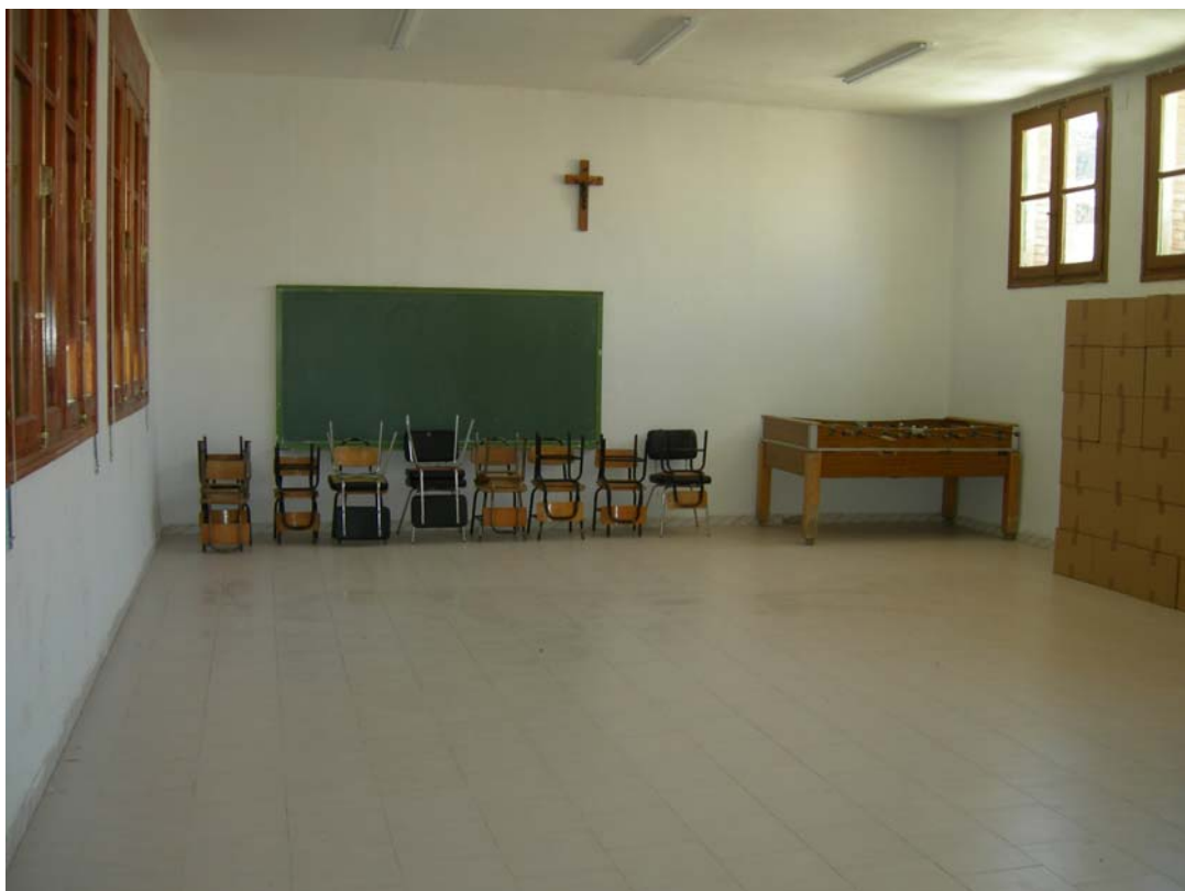
Fig. 6 Estado final del aula tras la retirada del laboratorio de campaña y ubicación de los restos humanos en cajas apiladas.