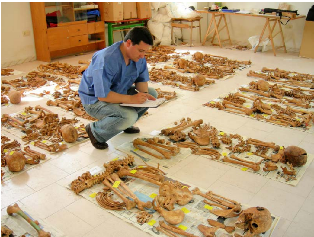
Fig. 2 Toma de datos antropológicos e inventario de materiales