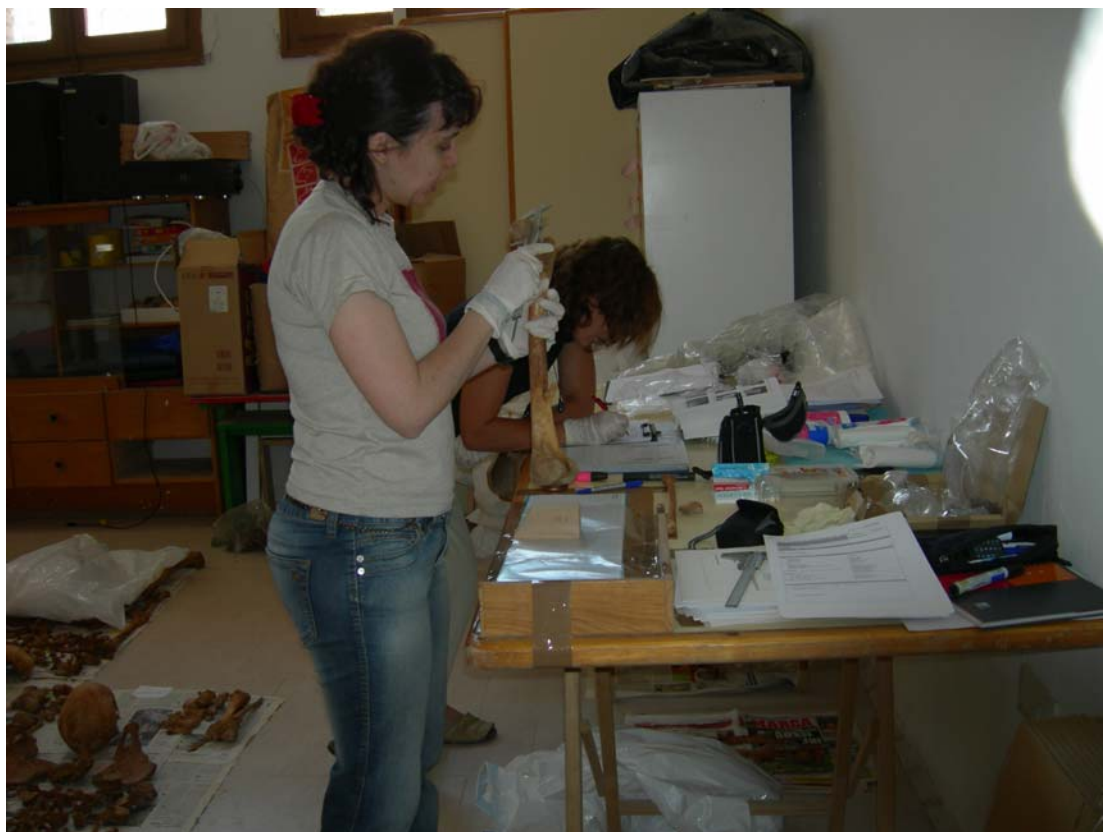
Fig. 3 Toma de datos antropológicos e inventario de materiales