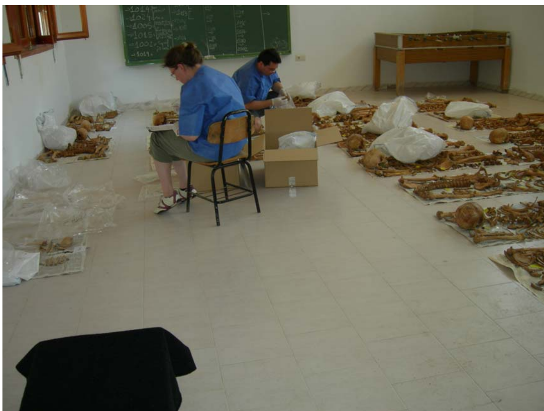
Fig. 4 Reintroducción de los restos antropológicos en cajas inventariadas