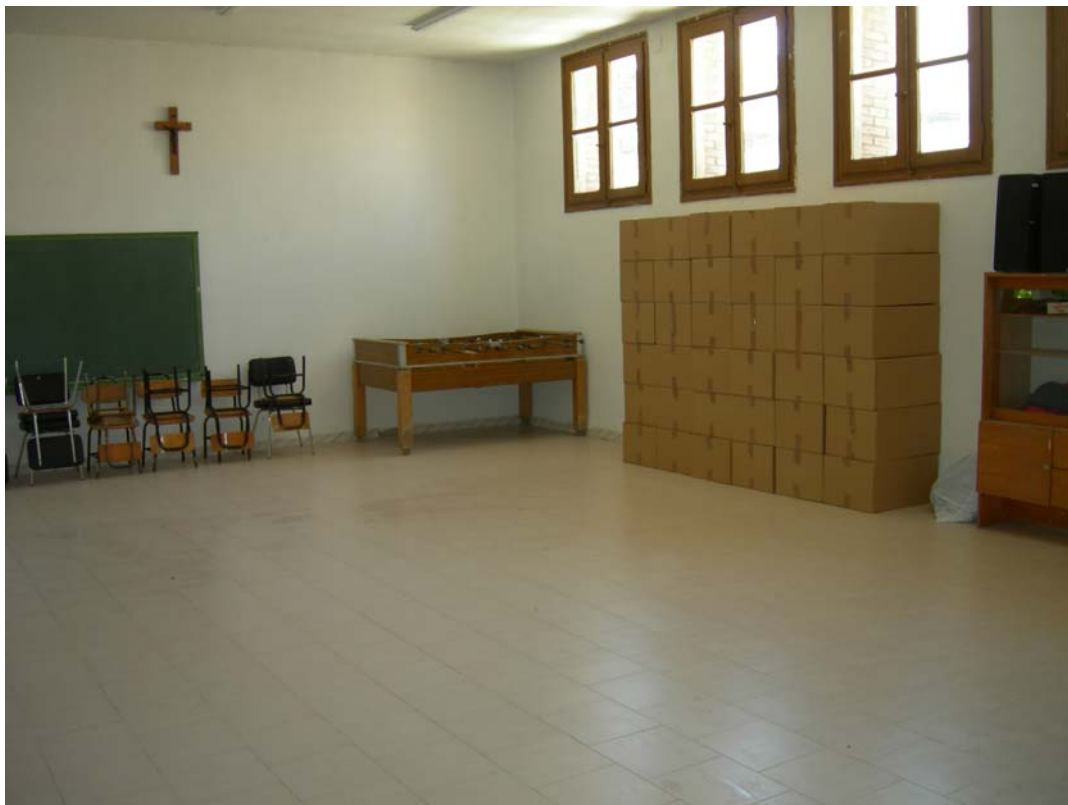
Fig. 5 Ubicación definitiva del material arqueológico tras su estudio